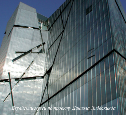
Еврейский музей по проекту Даниэля Либескинда