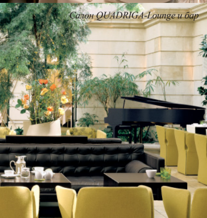
Салон QUADRIGA-Lounge и бар