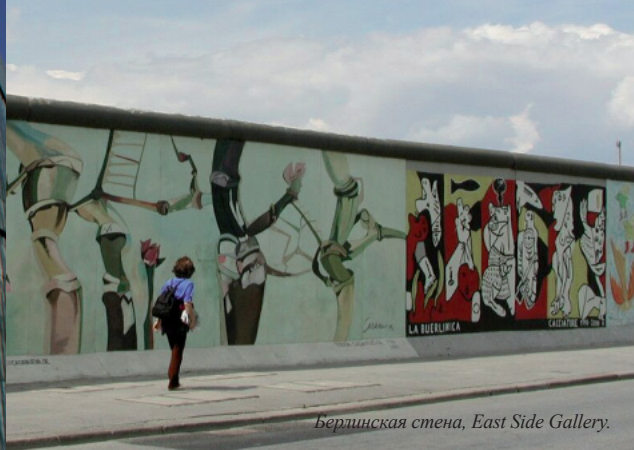
Берлинская стена, East Side Gallery.