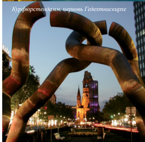
Курфюрстендамм, церковь Гедехтнискirche