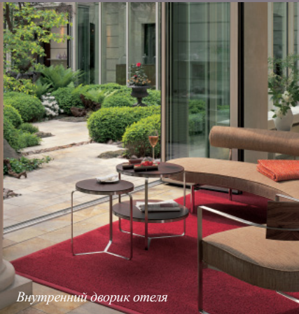
Внутренний дворик отеля

Ассоциация Small Luxury Hotels of the World