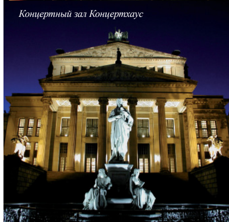
Концертный зал Концертхаус